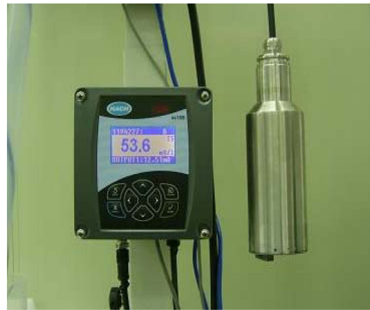
Fig. 2. Photography of suspended solids analyzer (Hach Solitax sc)

타내는 척도로써 보통 0.7 이상이면 매우 높은 상관성을 가지고 있는 것으로 알려져 있다.